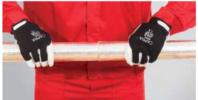
6. Kahe kõrvuti asetseva torukooriku otsad vajutatakse tihedalt kokku.