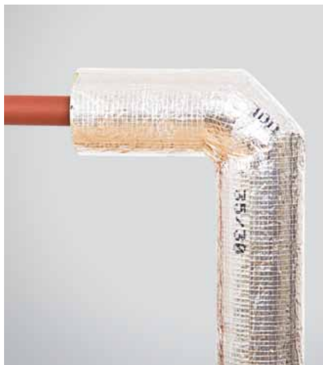
8. ROCKWOOL 800 torukoorikuga isoleeritud ühe põlvedetailiga torupõlv.