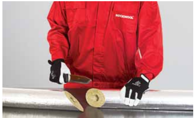
2. 45° nurga all kaheks osaks lõigatud torukoorik.