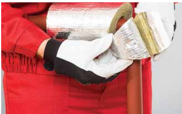
3. Torupõlve detaili paigaldamine.