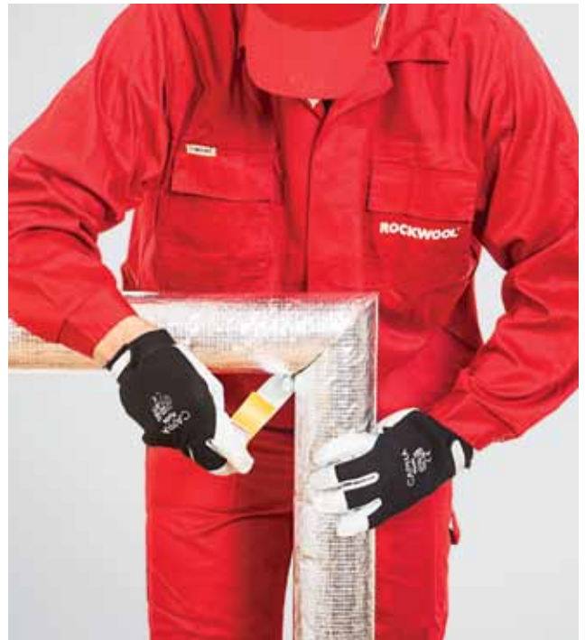
6. Torukoorkute ristiühenduse tihendamine alumiiniumteibiga.