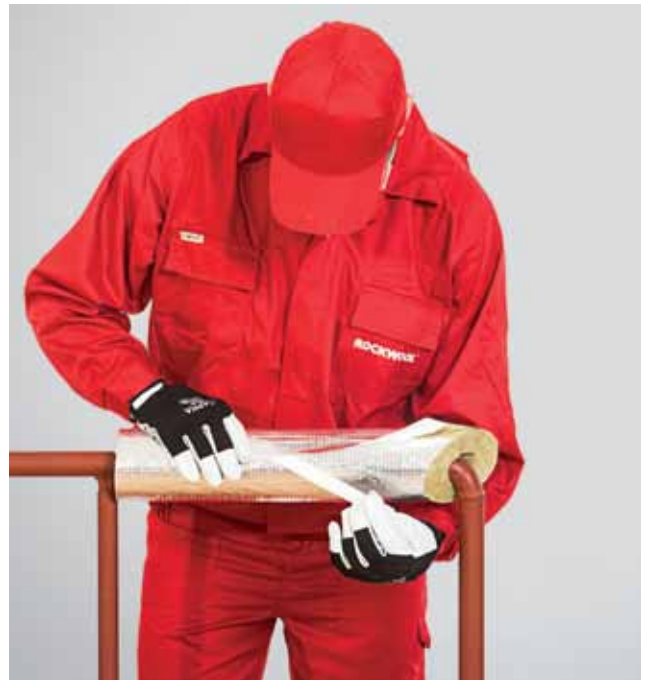
4. Torukoorku pikiühenduse kokku kleepimine kleepribaga.