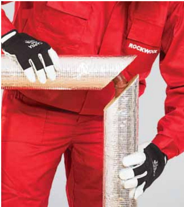
5. Torupõlve isolatsiooni mõlema osa ühendamine.