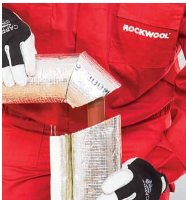
5. Isolatsiooni sirge osa paigaldamine.