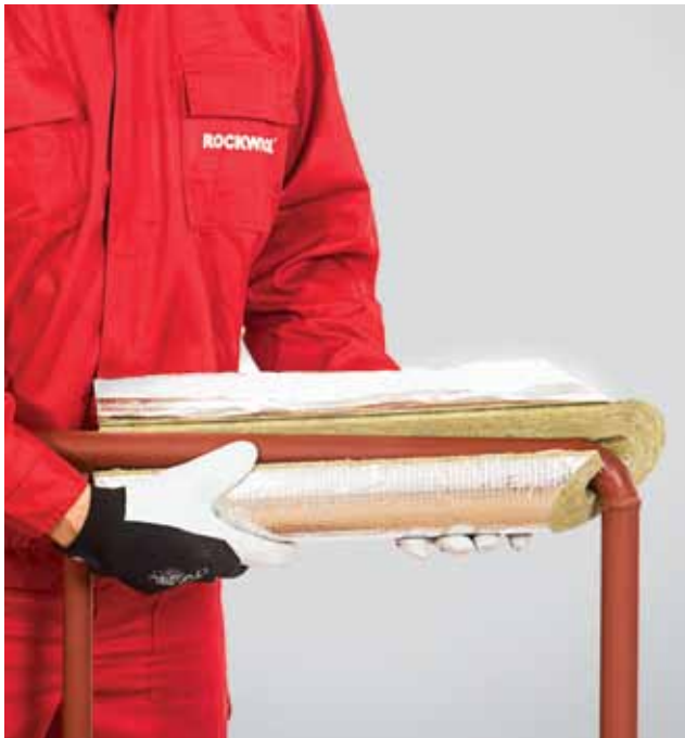
3. Isolatsiooni esimese osa paigaldamine torule.