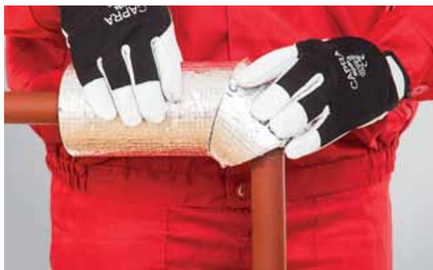
4. Torupõlve detaili täpne ühendamine torukooriku sirge osaga.