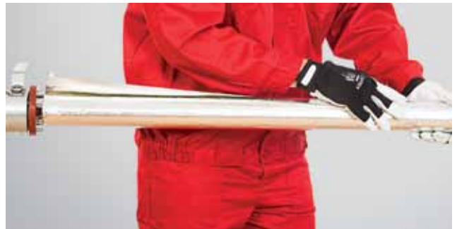
4. Kleepriba täpne kleepimine.