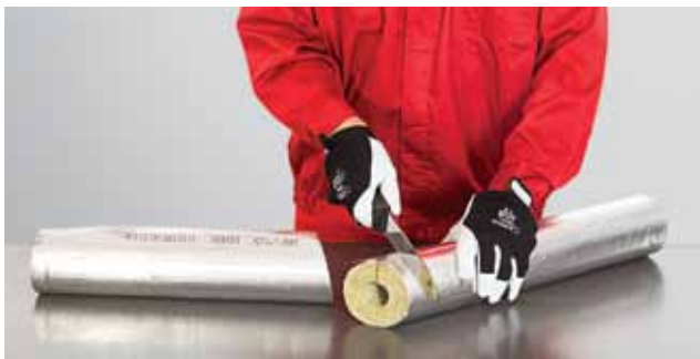
1. Torupõlve isolatsioonidetaili lõikamine, 1. samm.

Torukooriku ettevalmistatud detailid paigaldatakse järjest torule. Vastavalt torukoorikute paigaldamise reeglitele kohandatakse need toru läbimõõduga ja vajutatakse tihedalt kinni. Kõik pikiühendused kleebitakse kinni kleepribaga. Isolatsiooni üksikud osad vajutatakse tiheduse ja isolatsiooni ühtluse tagamiseks tugevalt üksteise vastu. Kõik osade ristiühendused ja liitekohad kaetakse alumiiniumteibiga.