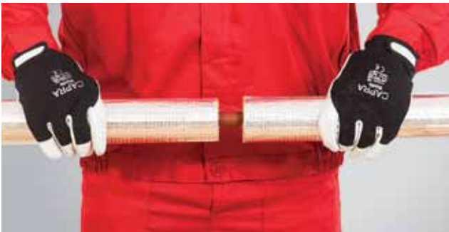
5. Kahe kõrvuti asetseva torukooriku ühendamine.