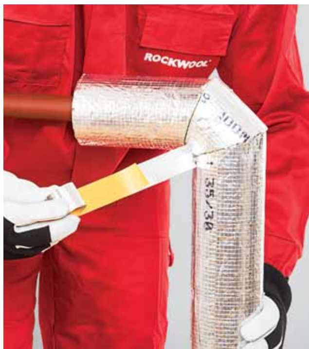
7. Ristiühenduste katmine alumiiniumteibiga.