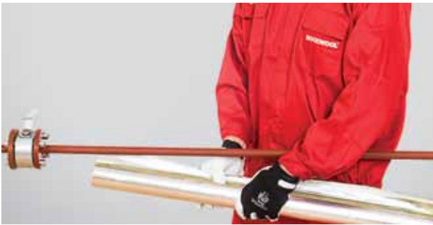
1. Torukoorik pannakse sirgele torule.