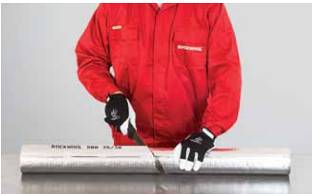
1. Torukooriku lõikamine vajaliku nurga alla.

Torukooriku pikiühendus kaetakse alumiiniumfooliumist kleepribaga ning kleebitakse täpselt kinni. Teist kooriku parajaks lõigatud osa pööratakse 180° ning pannakse torule samuti nagu pandi esimene osa. Torukooriku osad vajutatakse kokku nii, et need 90° nurga alla liituksid. Osade täpne ühendamine tagab isolatsiooni tiheduse. Liitekoht kleebitakse alumiiniumteibiga hoolikalt kinni.