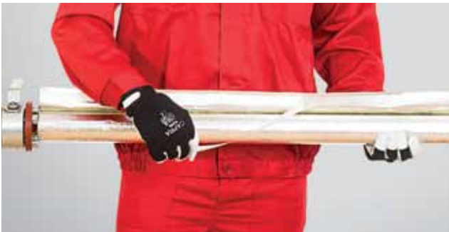
3. Kaitseriba eemaldatakse kleepribalt.