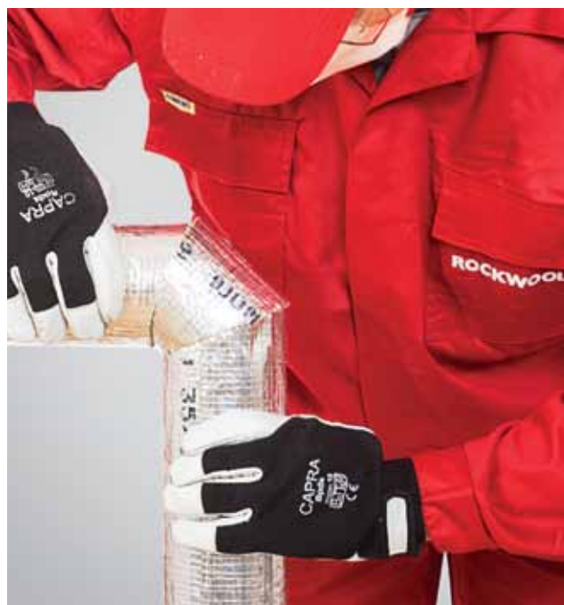
6. Kõigi detailide täpne ühendamine.