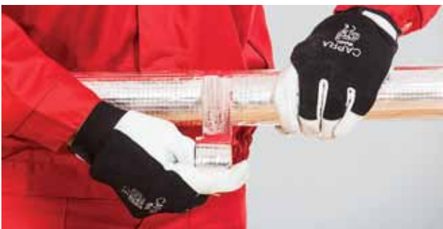
7. Torukoorikute ühenduskoht kaetakse alumiiniumteibiga.