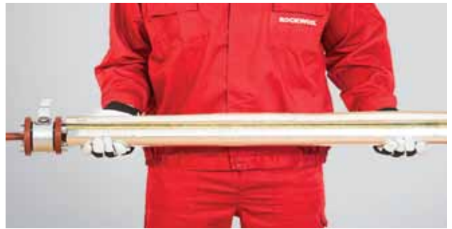
2. Isolatsioon kohandatakse toru läbimõõduga.