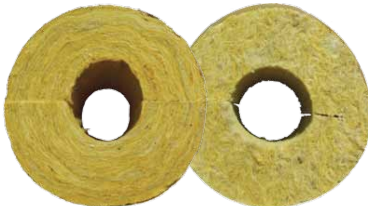
Tavaliste torukoorikute kiudude korrapärase struktuur

Moodsa tootmistehnoloogia abil valmistatakse laminaarse kiustruktuuriga kivivillast torukoorikuid ROCKWOOL 800 , mis paistavad silma oma optimaalse tiheduse, suurendatud jäikuse ning parimate soojusisolatsiooni- ja kasutusomaduste poolest.