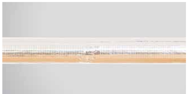
8. Valmis isolatsioon kahest ROCKWOOL 800 torukoorikust.