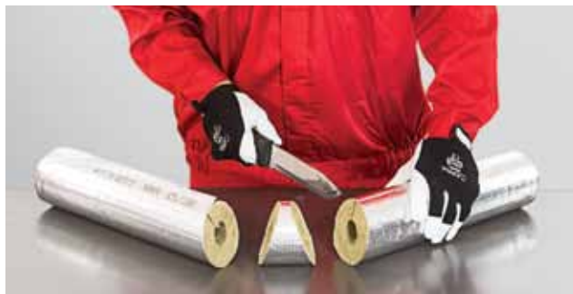
2. Torupõlve isolatsioonidetaili lõikamine, 2. samm.